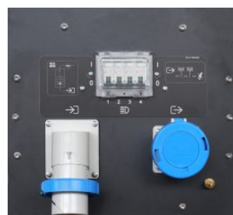
SCHALTAFEL MIT «LINK» KIT

Zusätzliche Steckdose für den Anschluss in Serie